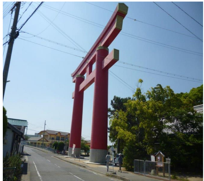
おのころ島神社 古代の御原入江の中にあつて、伊弉諾命・伊弉冉命の国生みの聖地と伝えられる丘にあり、古くから「おのこの島」と親しまれ尊敬されてきました。 縁結び・安産の神