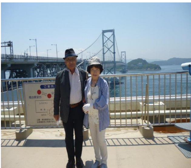
鳴門大橋をバックに、「いよ～、ご兩人さん」

「あわじ花さじき」から一路「道の駅うずしお」へ。お待ちかねの昼食です。 「島の小っちゃな玉手箱」には、淡路牛・天ぷら・生しらすの小っちゃなどんぶり入っていました。 淡路名物玉ねぎのサラダも美味しかったです。ビールも地酒も美味しかったです。