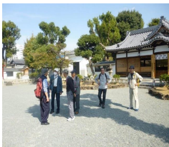
これで一行は摂河泉全ての国府所在地を完達