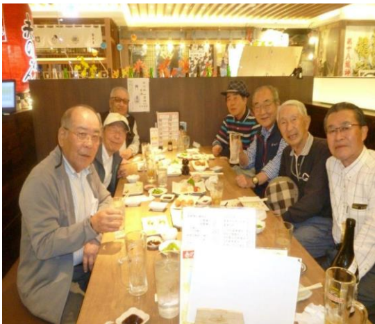
信仰厚き一同 乾杯! 本日の走行はここまで 約 18,000 歩也でした。