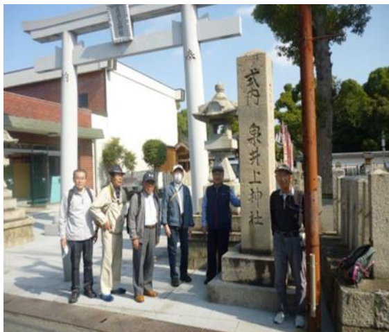
和泉国府址碑 泉井上神社近隣に。

（泉の国→（国名を二文字以上にとのお達しがあり）→和泉の国に。高さんより解説あり。