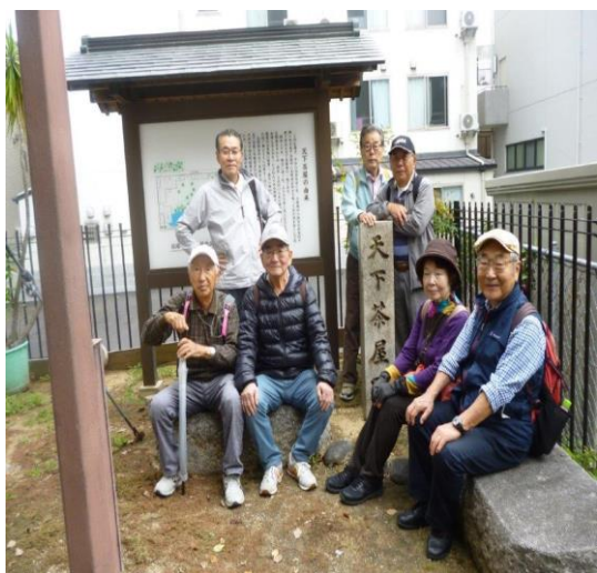
天下茶屋の跡の一角（秀吉が立ち寄り茶の湯を楽しんだ故事で有名）