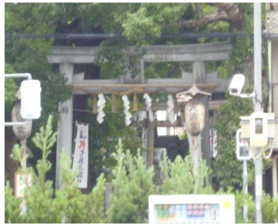
天神の森天満宮（淀殿安産祈願の為参詣）