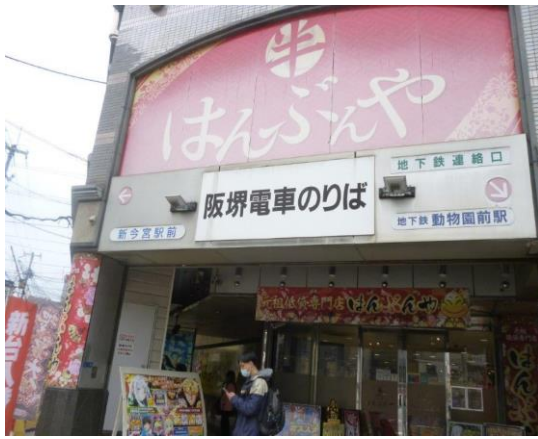
阪堺電軌阪堺線「新今宮駅」乗車場：J R 新今宮駅下