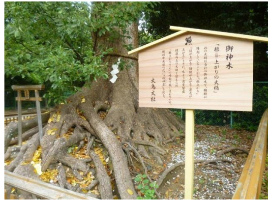
・日本武尊（やまとたける）を祀る 1000 年以上の歴史ある神社 ・当社のご神木「根（値）上りの大楠」樹齢 600 年