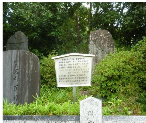
・出雲大社の大社造の次に古い社殿前 ・平治元年（1159 年）平清盛・重盛親子が戦勝祈願