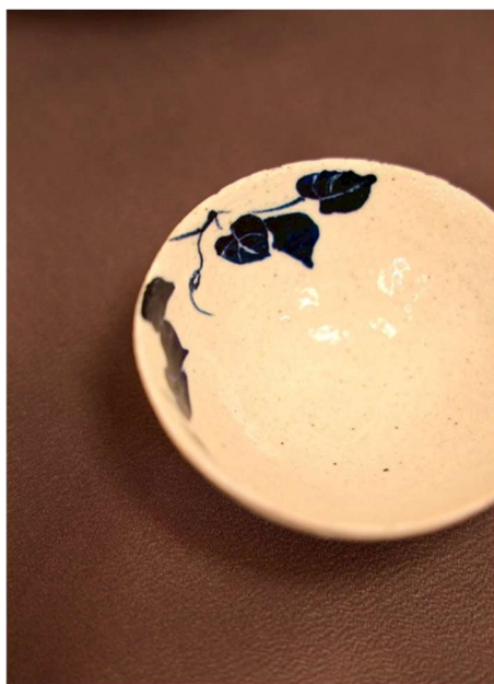
盃、呉須絵、五斗蒔土

右の徳利も還元窯ですが、こちらは釉薬を打たず、裸の胎土が LPG 燃料の炎を、4 時間、浴び続けました。