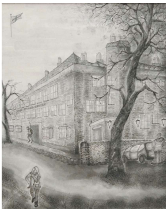
Jack Straw's Castle, London

このように墨絵では、白色を「余韻」として、あるいは「気韻」や「無」として表現します。