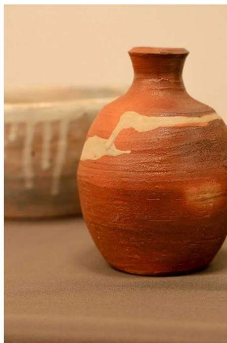
徳利、焼締白泥流し、信楽土