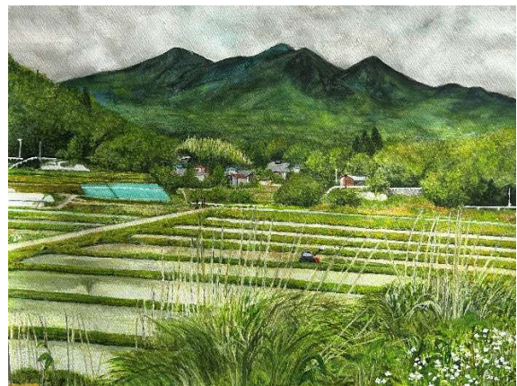
【水彩画】 『八ヶ岳の麓』（F 6号）