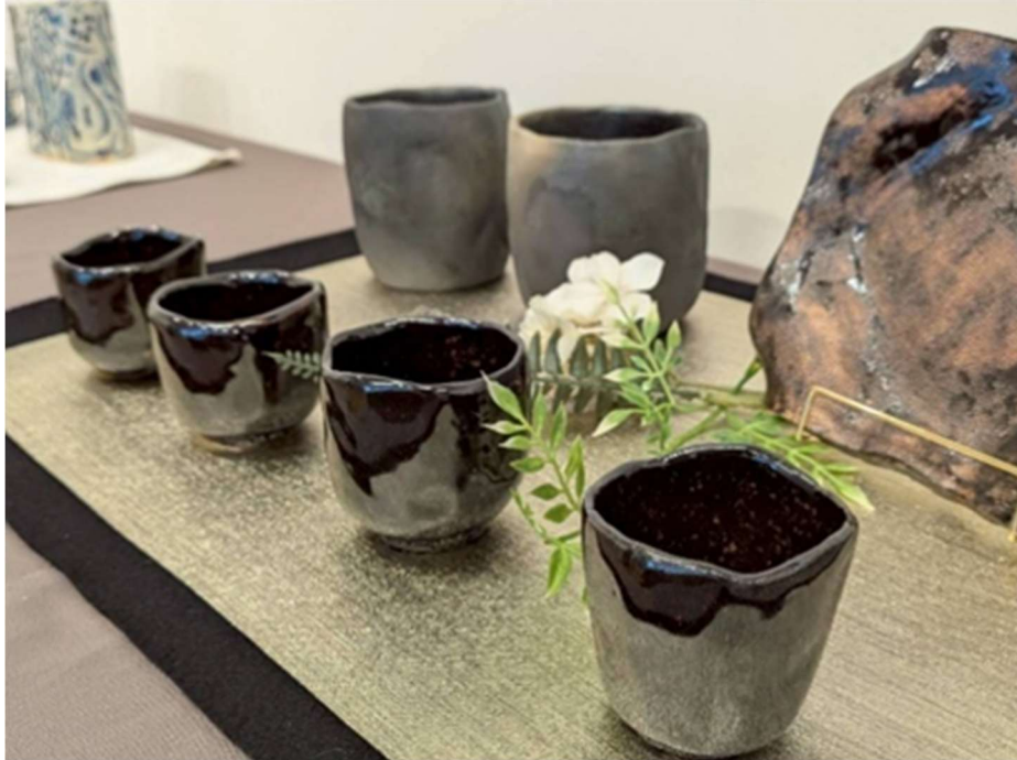
【五彩展：陶芸作品（ぐい呑み他）】

また友人の誘いで陶芸教室にも挑戦し、土を手のひらで形作る時間は、自分の思いを手で表現する楽しさを教えてくれました。 焼き上がった器には、想像をはるかに超えた形や色、世界にひとつだけの自身の表情をもつ作品を手にする喜びも知ることができたような気がします。