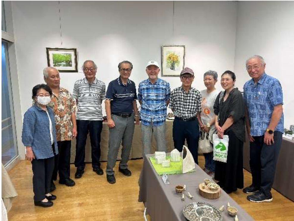
【五彩展にて美術部の皆さん及び来客者と】

また美術部の皆さんも見学に来ていただき、更に創作意欲が増すエネルギーをいただいたように思います。