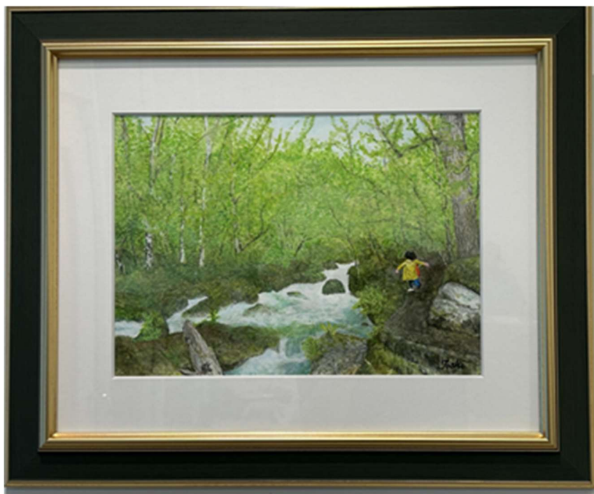
【五彩展：水彩画】 『ふるさとの林と川』(F 4号)

思い通りにデッサンができず、また筆が動かず悩む時期もありました。しかし、山や川、雲や草木の色を思ったように描き出せたときの喜びは格別でした。