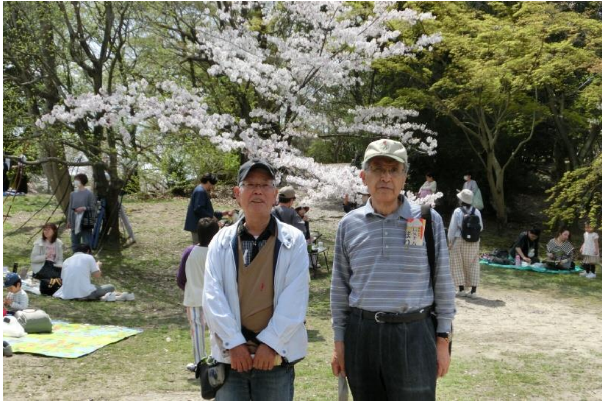
長久手古戦場公園①