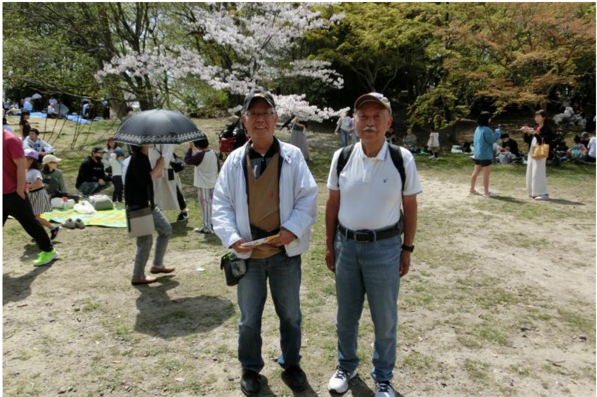
長久手古戦場公園②